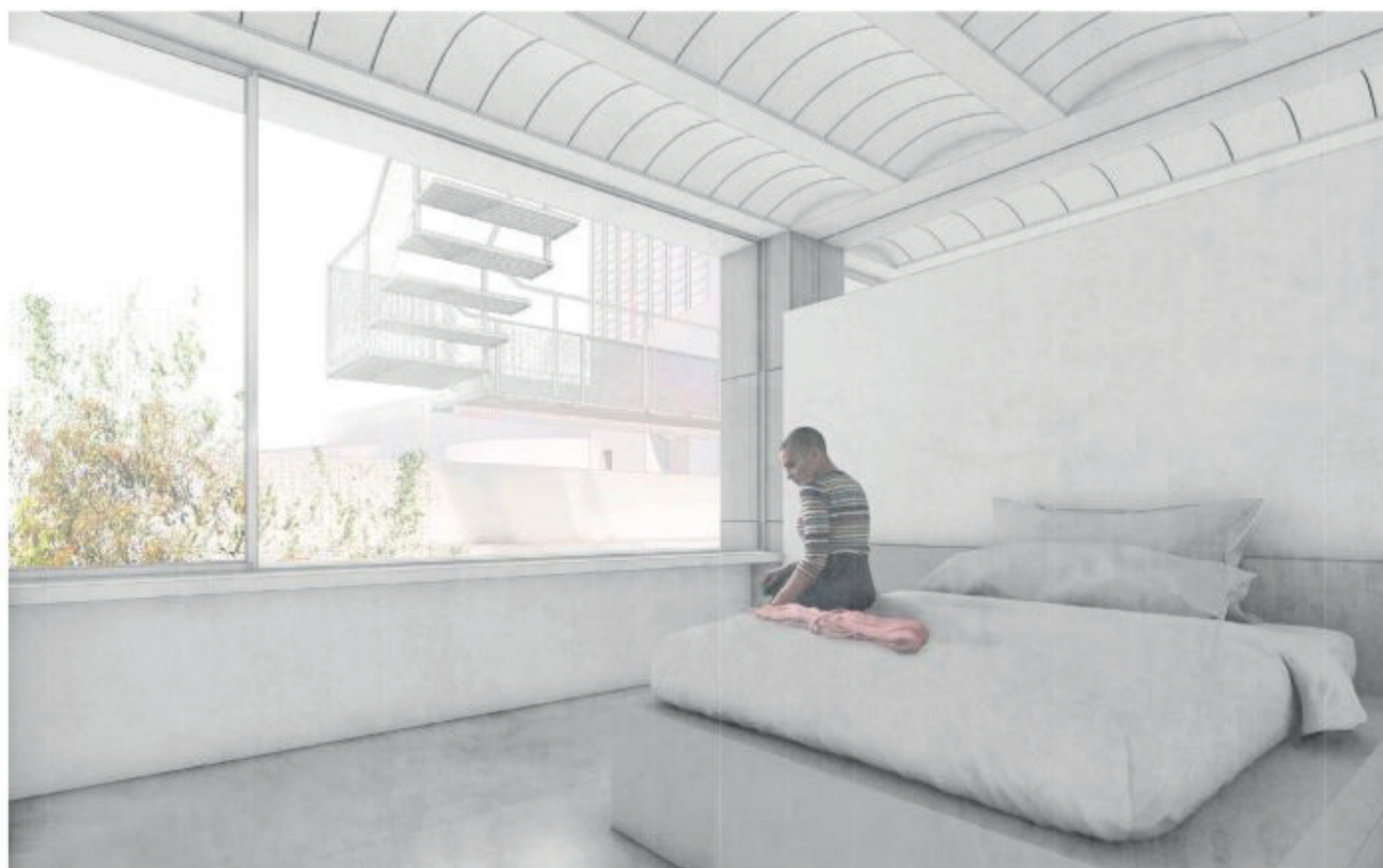
DORMITORIO PADRES Vista hacia el rebosadero de la alberca