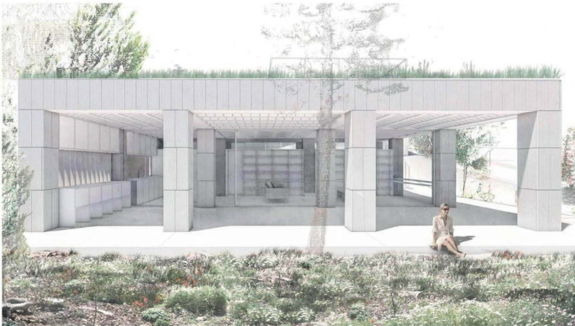
VISTA SUR Alzado frontal desde el jardín