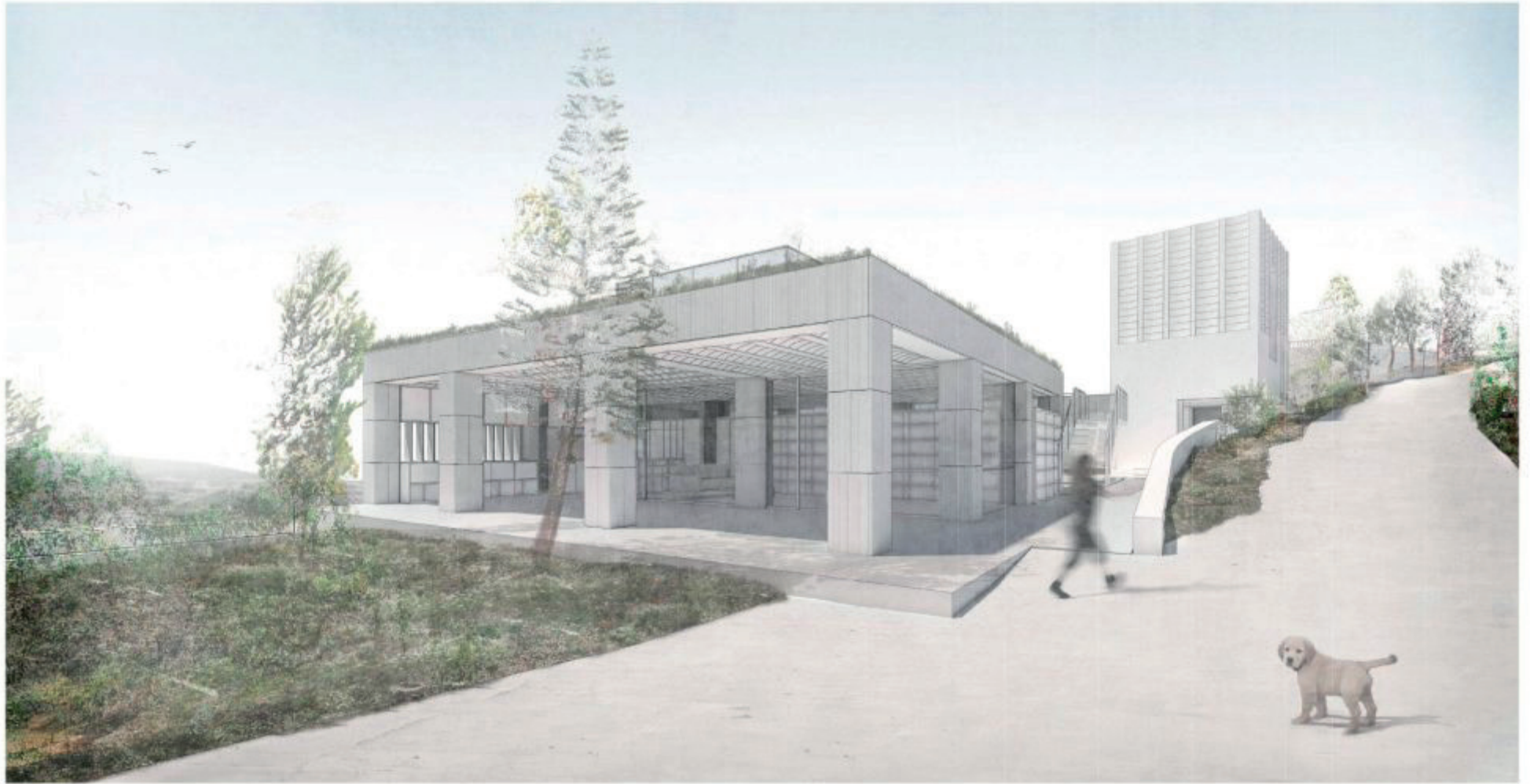
VISTA SURESTE Acceso principal a la vivienda.